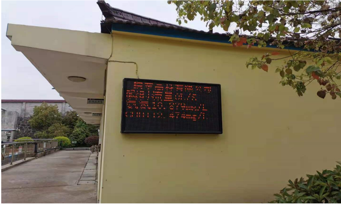
废气（非甲烷总烃）在线监测